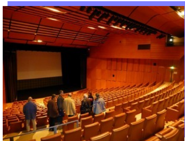
L'auditorium Ronsard peut accueillir près de 700 personnes.

Les détails sur l'organisation du congrès (répartition des tâches des bénévoles) et l'ordre du jour figurent sur le site du comité départemental : www.ffct37.org