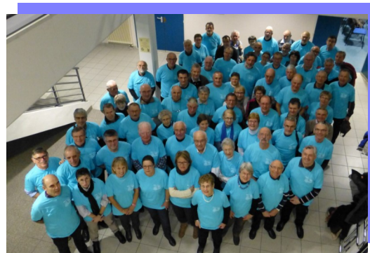
Le congrès 2014 leur doit sa réussite!

Autre réunion : la « réunion bleue » qui a rassemblé les bénévoles qui ont apporté leur concours à l'organisation du congrès fédéral à Tours, en décembre dernier. Ils avaient revêtu le t-shirt bleu qu'ils portaient un mois et demi plus tôt. On s'est rappelé des souvenirs, on a échangé des informations, vu quelques images et levé son verre en pensant notamment aux organisateurs du congrès 2015 à Montpellier.