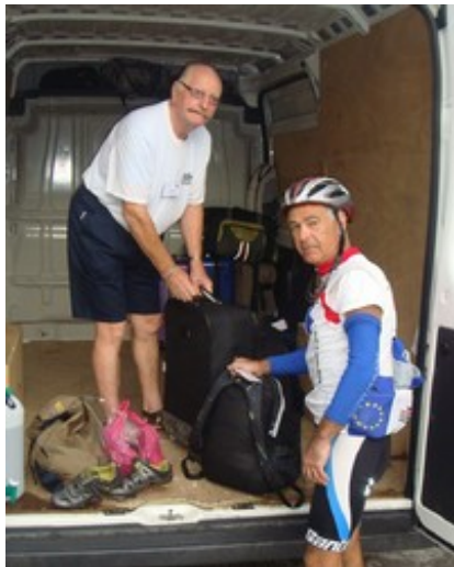
Le bagagiste dans ses œuvres.