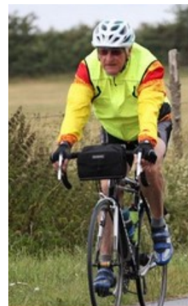
Sous les couleurs de Chinon.

Je ne te le fais pas dire ! Cela fait chaque jour quelques tonnes de bagages à manipuler, c'est effarant. Charger le matin, décharger le soir, dispatcher en fonction des différents lieux d'hébergement, dans nos trois véhicules de 3,5 tonnes. Je ne parle pas de la paire de chaussures oubliée dans le sac enfoui tout au fond du camion, et qu'il faut absolument retrouver avant le dé-