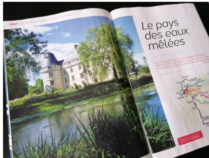
Le château de l'Islette ouvre le dossier de Cyclotourisme.

La Touraine est à la fête dans le numéro de septembre (n° 704) de Cyclotourisme , la revue fédérale. Un dossier de sept pages est consacré à ses trois randonnées permanentes, trois idées de voyages courts ou prolongés, pour des cyclos venus de loin comme pour les Tourangeaux.