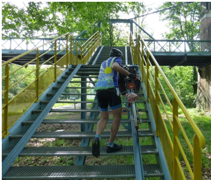
Escaliers et marches pour le comité régional.

Un thème adultes : « Escaliers, marches ». Un deuxième pour les jeunes : « A l'assaut d'une pente ». Un vélo doit obligatoirement figurer sur les photos.