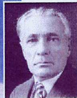
Henri Desgrange et ci-contre son monument au col du Galibier

Une organisation de l'Union des Audax Français - UAF