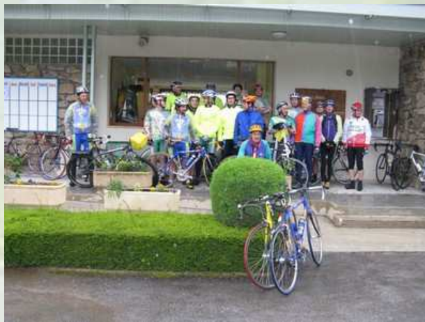
Le Gazelec au départ de Laouzas sous la pluie

Ce mauvais climat ne durera heureusement qu'une journée et les autres étapes bénéficièrent d'un temps ensoleillé qui nous permit d'admirer le paysage au Mont Aigoual, l'abîme de Brambiau, les menhirs de la Pierre Plantée, la source de l'Hérault.....et de respirer les senteurs d'une végétation méditerranéenne.