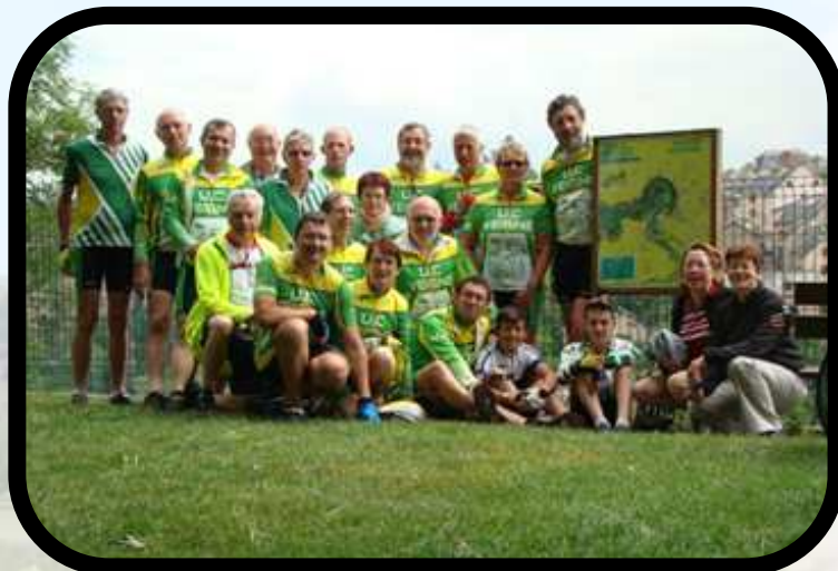
Halte au Trou de Bozouls.

L'après-midi a été consacré à la visite de Conques et de son abbaye dont les sculptures du porche sont remar-