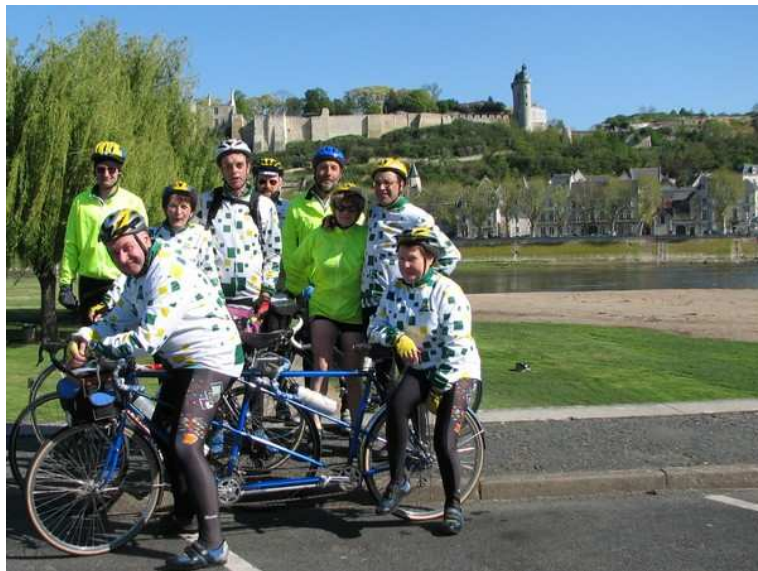
La Loire à vélo en passant par Chinon

Maintenant nous allons préparer la marche des dauphins qui aura lieu le dimanche 14 janvier 2007 .